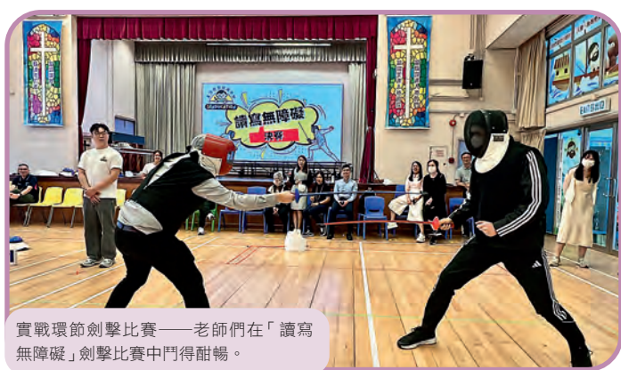
實戰環節劍擊比賽——老師們在「讀寫無障礙」劍擊比賽中鬥得酣暢。

「童行學習發展中心」亦為中小學提供教師專業培訓，讓老師能透過劍擊體驗運動學字，感受這項活動改善學習成果的有效性。