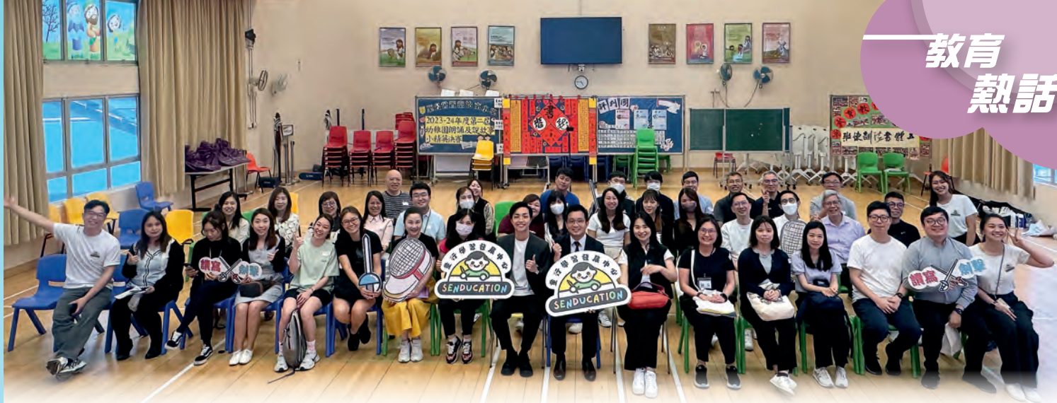
多間學校參與劍擊讀寫體驗日——「童行學習發展中心」為中小學提供教師專業培訓，讓老師透過劍擊體驗運動學字，感受這項活動改善學習成果的有效性。